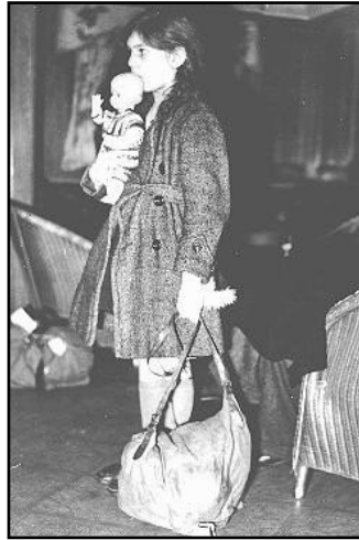
Ffoadur, rhan o gludiant plant (Kindertransport), yn fuan ar ôl cyrraedd Harwich, Prydain Fawr, 2 Rhagfyr 1938.

Delwedd: United States Holocaust Memorial Museum . Cedwir y ddogfen wreiddiol yn Bibliothèque Historique de la Ville de Paris .