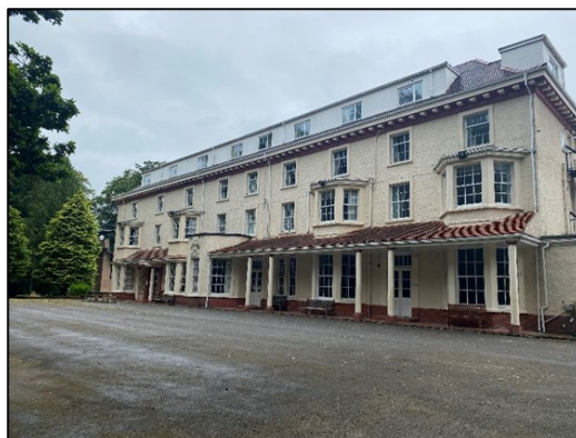
Abernant Lake Hotel yn Llanwrtyd.