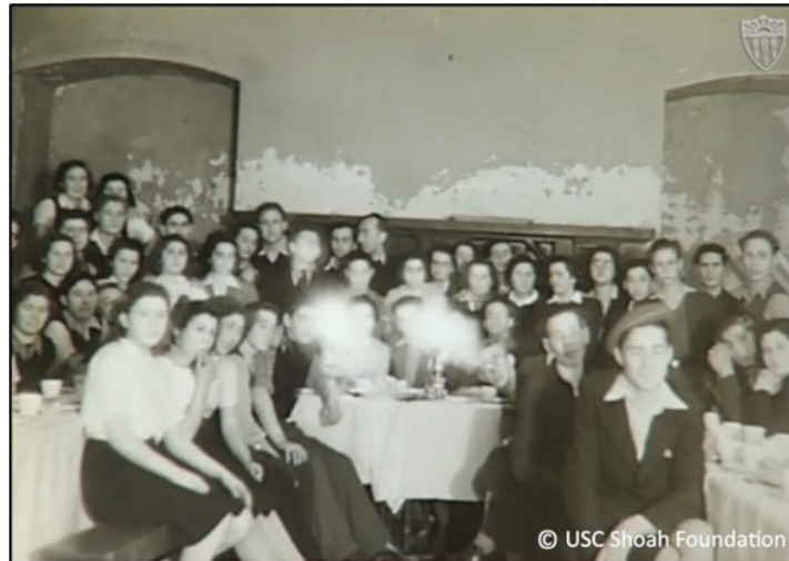
Myfyrwyr yng Nghastell Gwrych.

Delwedd: United States Holocaust Memorial Museum . Cedwir y ddogfen wreiddiol yn Bibliothèque Historique de la Ville de Paris .