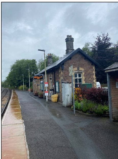
Gorsaf Drenau Llanwrtyd, 2021.