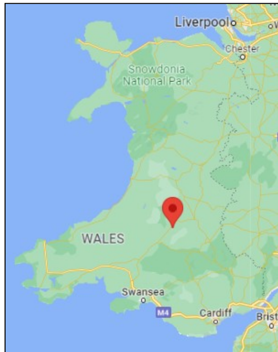
Map o Gymru.

Taflwch fap gwag o Gymru ( Taflen 3 ) ar y bwrdd gwyn, gofynnwch i'r myfyrwyr a allant ddod o hyd i Lanwrtyd (wedi'i farcio'n goch) a hefyd eu lleoliad eu hunain. Fel cwestiwn cyffredinol, gofynnwch i'r myfyrwyr a ydyn nhw'n gwybod am y dref hon. Eglurwch y byddan nhw'n clywed tystiolaeth gan un o orosywyr yr Holocaust a phlentyn a ddaeth i Lanwrtyd fel ffoadur yn y 1930au.